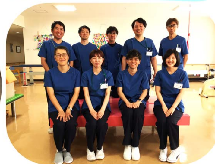
理学療法士・作業療法士