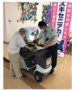
令和5年 地域貢献活動より

出店 宮崎ヒューマンサービス(福祉用具展示) カクイックスウイング(福祉用具展示) LOCO(パン販売) 福祉ネイル(体験できます) 乾式ヘッドスパ